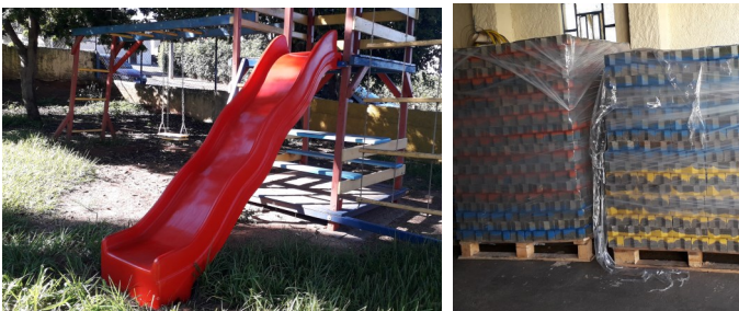
De nieuwe glijbaan is geplaatst en de rubber tegels staan klaar om gelegd te worden.

In 4 groepjes zijn de kinderen in de Lar geweest en voor de kinderen was het een feest om elkaar weer te zien! (en ook een cadeautje te krijgen...).