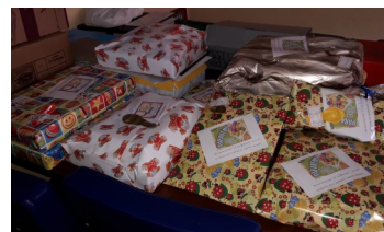
Cadeautjes voor de jarige kinderen

Er worden er nog steeds voedselpakketten uitgereikt. Ook de jarige kinderen worden niet vergeten.