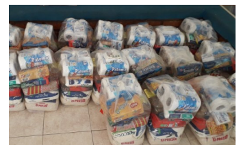
Voedselpakketten staan klaar

We hopen dat de situatie beter wordt, maar op dit moment zijn de vooruitzichten nog niet erg hoopvol, zoals u ook in de media heeft kunnen zien. Wel mogen we weten dat wij ook in situaties als deze onze hoop mogen stellen op de Opgestane Heer, Die ons helpt en leidt.