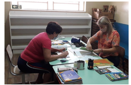
Werkzaamheden in de bibliotheek

Onze leidsters zijn heel druk bezig. Zij proberen alles bij te houden zo maken ze de "bibliotheek" weer in orde versieren de gang. Maar vooral het voorbereiden van