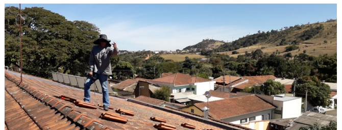
Achter de monteur zijn de zonnepanelen te zien die voor warm water zorgden.

Zo zie je maar, wij zijn de vrieskou hier in Brazilië niet gewend!