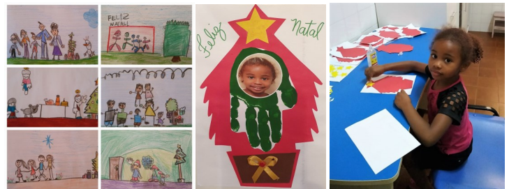
Prachtige tekeningen en kerstkunstwerkjes van de kinderen

Vorige week maakten wij de kersttekeningen om naar Nederland te sturen. Alle kinderen deden hun best en zeiden: "Ik ga een hele mooie tekening maken voor mijn "peetouders". Ook de kleine kinderen van onze groep waren enthousiast, want op hun plakwerkjes stond hun foto.