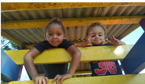
Plezier in de Lar !